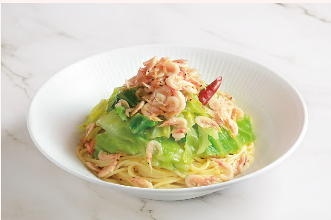
釜揚げ桜えびと春キャベツのアンチョビソース

自社製の生パスタ、ナポリ風ピッツァ、本格ソースなど、イタリアンダイニング DONA のこだわりを感じていただけるメニューの数々を、世界各地から選りすぐったワインと一緒に堪能ください。