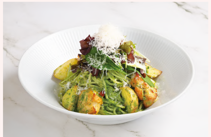
新じゃがいもとローストチキンのジェノベーゼ