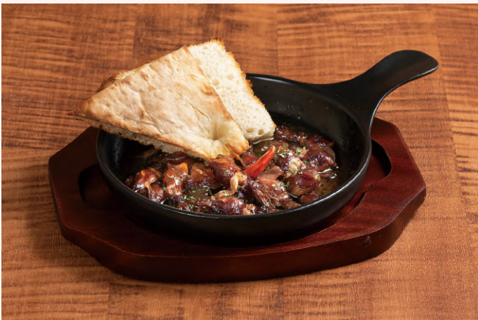
富山県産ホタルイカのアヒージョ